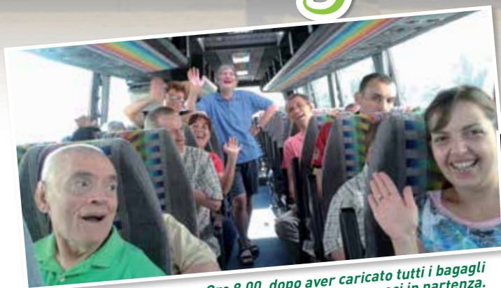
Ore 8.00, dopo aver caricato tutti i bagagli ...eccoci in partenza.