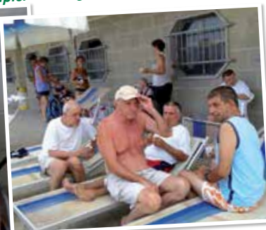
...Ritornare è gioire di essere nuovamente attesi!