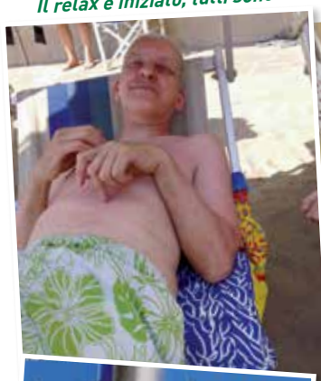
Il relax è iniziato, tutti sono sdraiati sui lettini a prendere la tintarella.