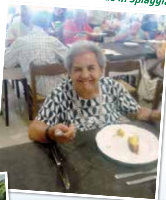
A piccoli gruppi ci concediamo una merenda in spiaggia.