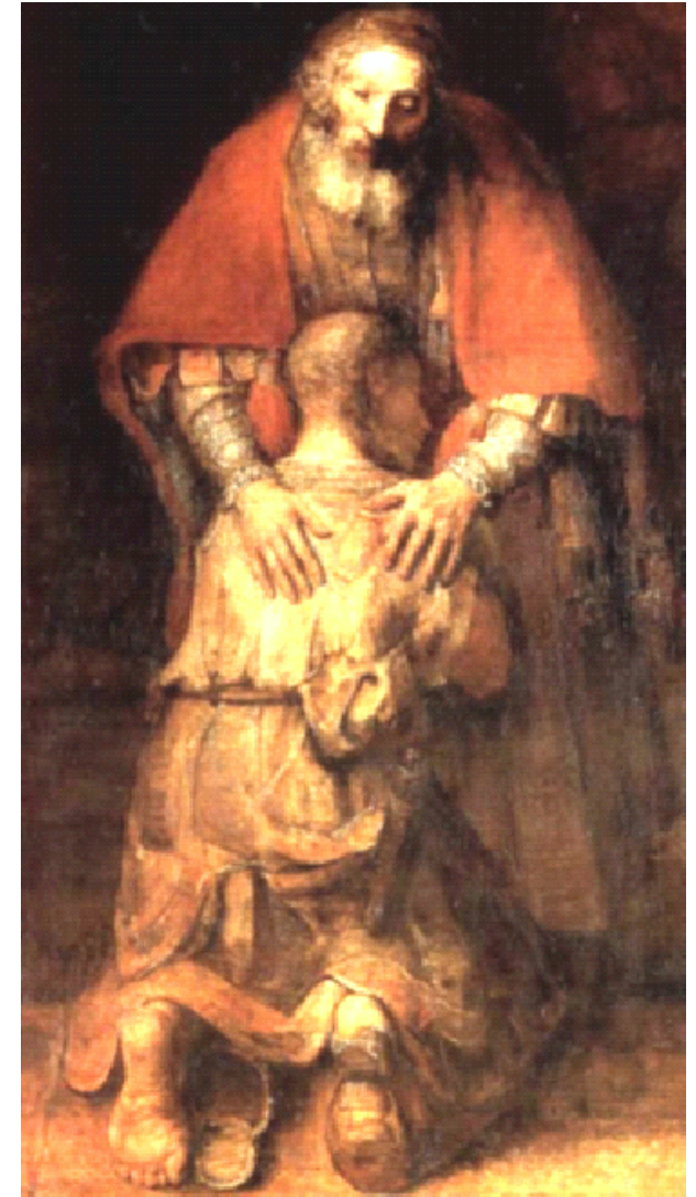
Ritorno del figliol prodigo (Rembrandt, 1668)