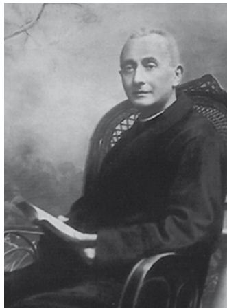
Beato Francesco Spinelli

Alle suore, da diversi anni, si affianca la "Fraternità Eucaristica Spinelliana", un'associazione